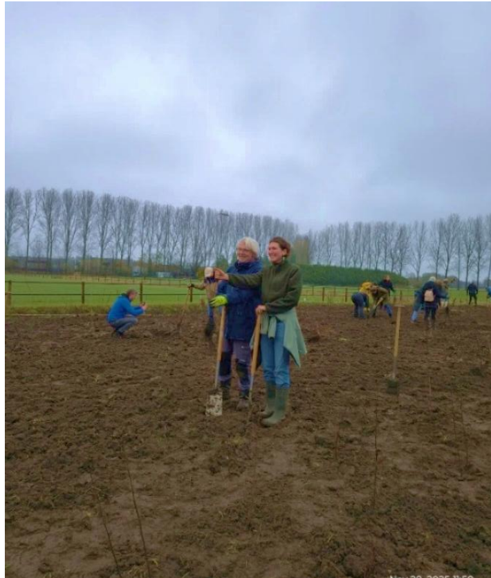
Foto: Aanplant langs de Grootte Waterloop