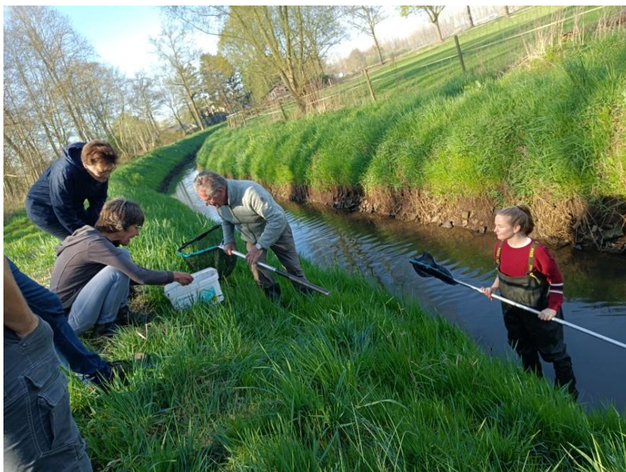
Foto: Scheppen uit de Groote Waterloop

Misschien wel het leukste onderdeel van de cursus was het zelf ontdekken hoeveel leven er is in de Goote Waterloop en de poelen rondom de Groote Waterloop. We hebben met grote schepnetten de fauna van de Groote Waterloop hebben bekeken.