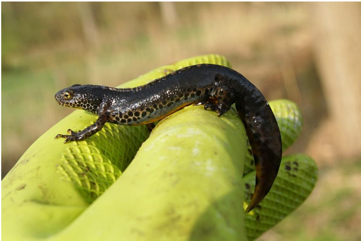
Foto: Alpenwater salamander

Op 24 maart zat er een Alpenwater salamander tussen de andere soorten. Een soort die we in Liempde nog niet eerder hebben gezien.