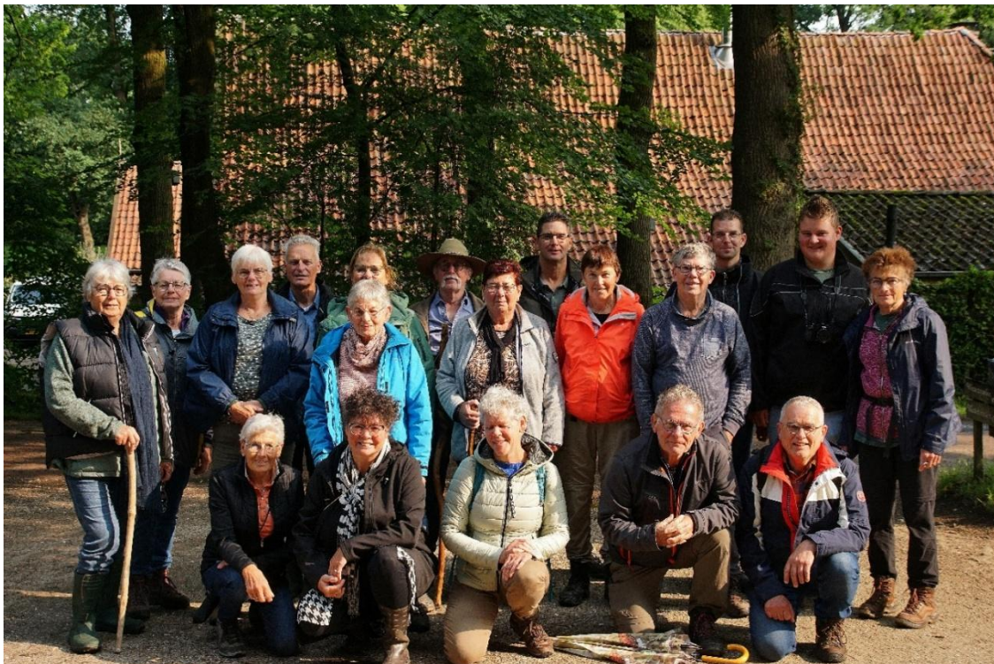
Foto: Deelnemers Pinksterweekend 2025 in Hezingen